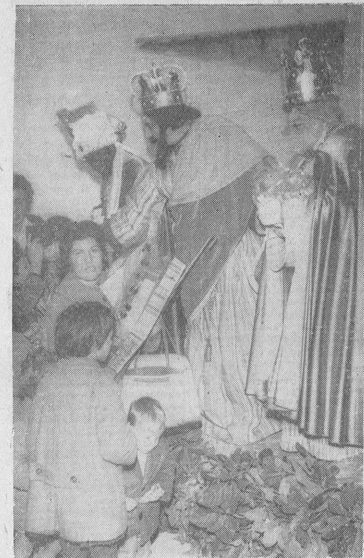
Los Reyes Magos repartieron in finidad de juguetes en Pontesa

Dirección . . . . 15 6 15 Redacción . . . . 15 6 16 Administración y Talleres . . . . 15 6 14