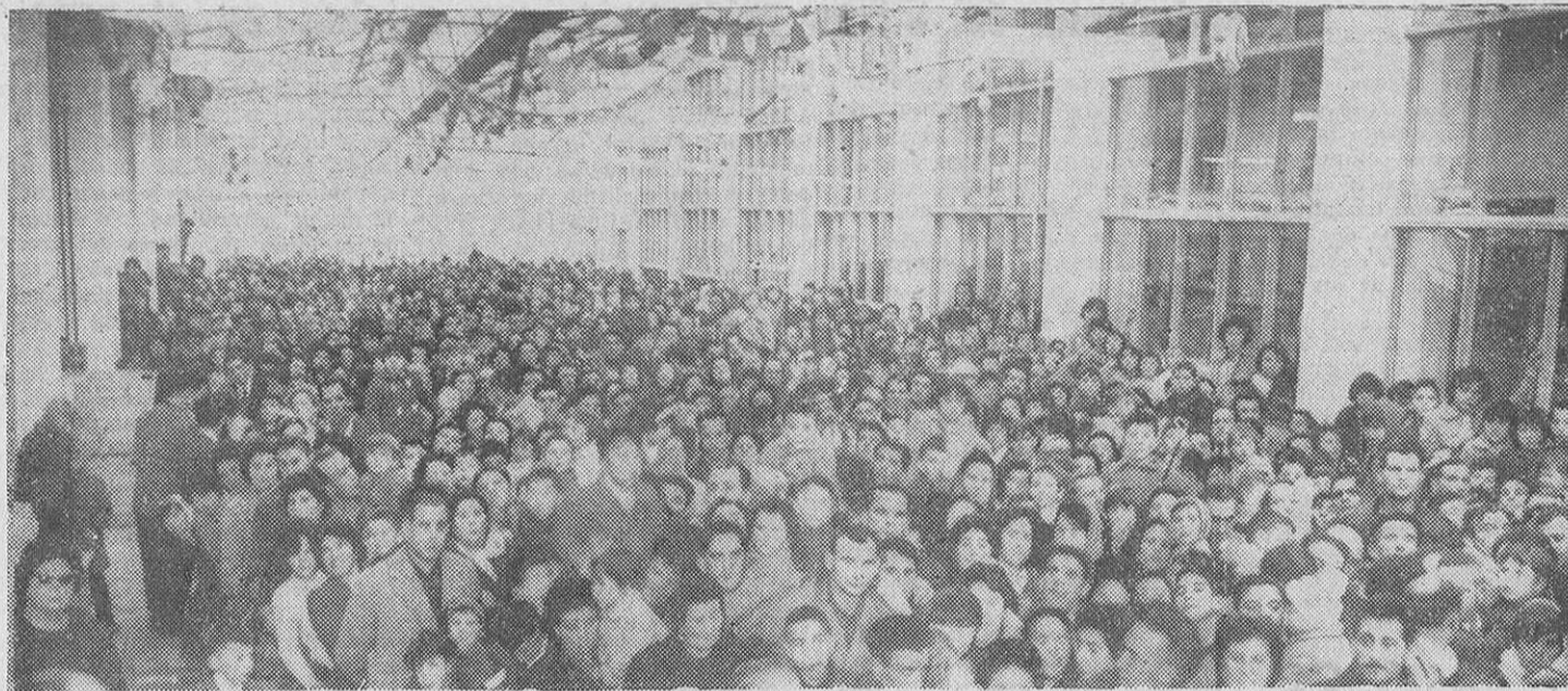
Este impresionante aspecto ofrecía la factoría de Pontesa durante la hermosa fiesta celebrada ayer

MILES DE JUGUETES FUERON ENTREGADOS A LOS HIJOS DE LOS PRODUCTORES, EN UN BRILLANTE ACTO DE CONFRATERNIDAD