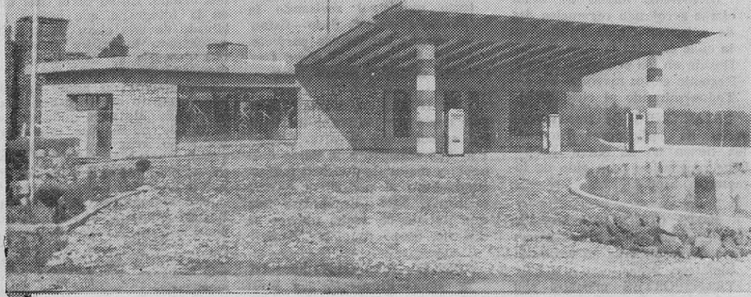
ORENSE.--A nueve kilómetros de la capital, por la carretera de Santiago y Lugo, acaba de ser inaugurada la Estación de Servicio San Cristóbal, en cuya elegante y atrevida visera se emplearon VIGUETAS CASTELO, de Pretensados del Louro, S. L.