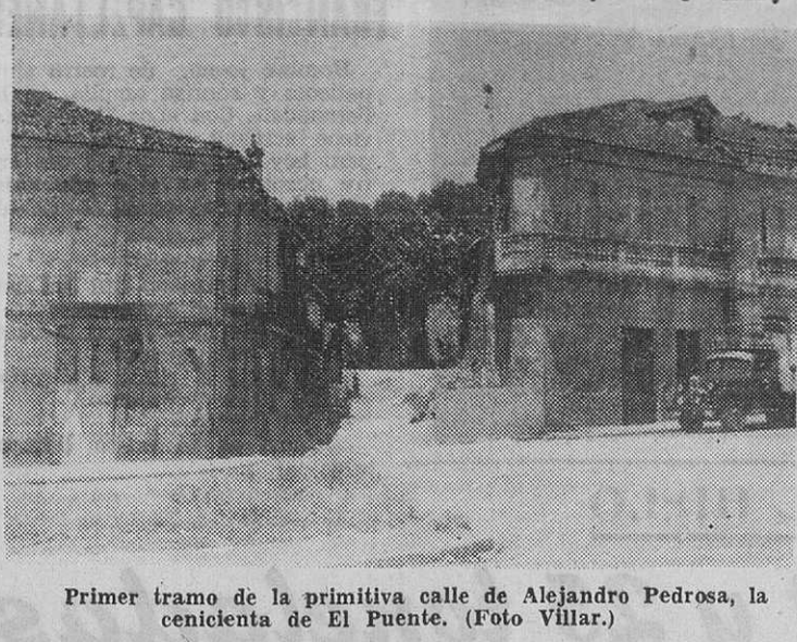
Primer tramo de la primitiva calle de Alejandro Pedrosa, la centicieta de El Puente.

que no es corriente que en carreras de un solo día, se encuentren los corredores con premios de 10 y 7 mil pesetas. --¿Se traducirá ello en una buena participación? --Si geográficamente estuviéramos bien situados, desde luego.