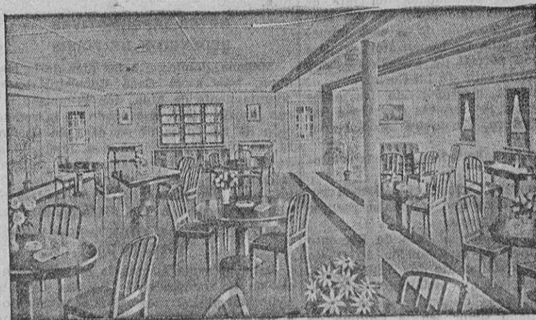
El "Hall" de la tercera clase del "General Osorio", ofrece al pasajero una instalación completa para efectuar el viaje con toda comodidad

Como ya es costumbre de la Hapag, ambas clases tienen peluquerías, baños, bibliotecas, cines, orquestas, sección para la venta de varios artículos y toda clase de instalaciones que permiten al pasajero efectuar las travesías con toda comodidad. Un servicio bien organizado y comida bien condimentada contribuyen a que el pasajero disfrute en este nuevo buque de la Hamburg-Amerika Linie de todas las ventajas de un viaje marítimo.