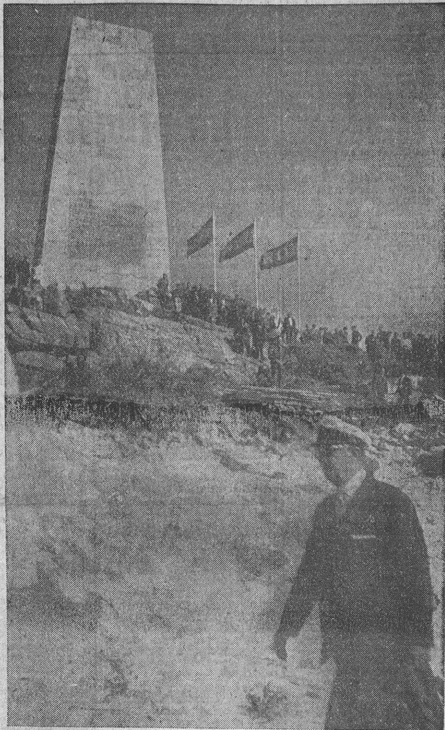
Hasta el hito conmemorativo de las Cíes, el recorrido de Franco fué un paseo triunfal entre gentes de toda la provincia que lo aclamaban sin cesar.