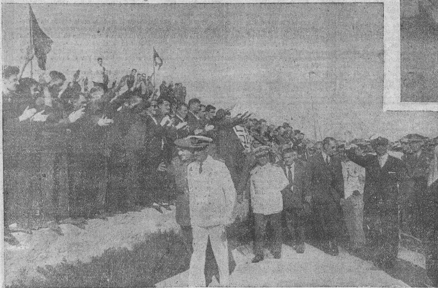
Gentes llegadas de todos los lugares de Pontevedra aclamaron al Jefe del Estado en las Cíes, rindiéndole el homenaje de toda la provincia envuelto en una jubilosa explosión de afecto popular.

Sobre este tema, publicamos en páginas interiores, diversos trabajos de nuestro servicio especial de PYRÉS.