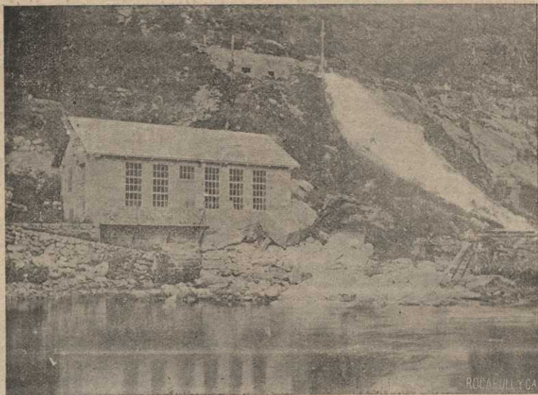
FÁBRICA DE ARANZA

La industria gallega ha progresado de tal modo en estos últimos tiempos que ya no se puede decir que es Galicia aquel país hacia el cual se miraba, no ha mucho aún, desde afuera, como á la imagen del atraso.