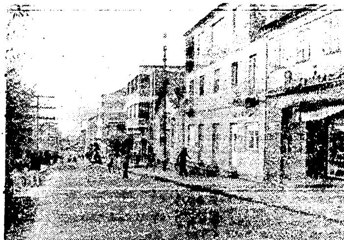
UN ASPECTO DE LA VILLA ARCADENSE